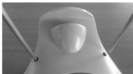
Figura 4 Installazione del supporto della cuffia