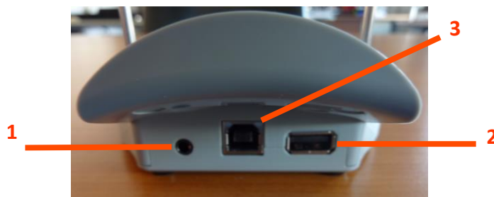
Figura 5 Lato posteriore – Supporto connettività