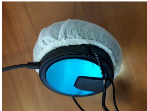
Figura 7 Posizionamento del copriauricolare igienico su un auricolare della cuffia