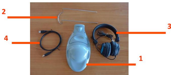
Figura 2 VisioClick® e i suoi accessori