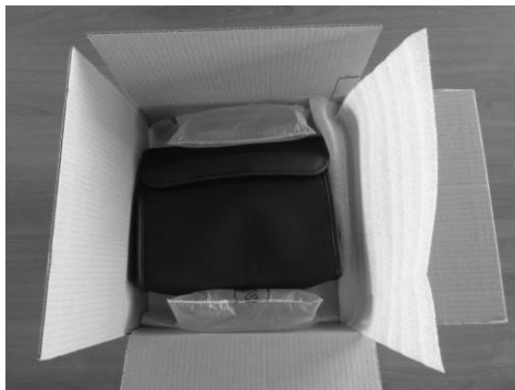
Figura 1 Apertura della confezione originale del dispositivo VisioClick®

Consigliamo caldamente di conservare l'imballaggio originale del dispositivo VisioClick® nella sua integrità per eseguire eventuali ulteriori interventi di manutenzione.